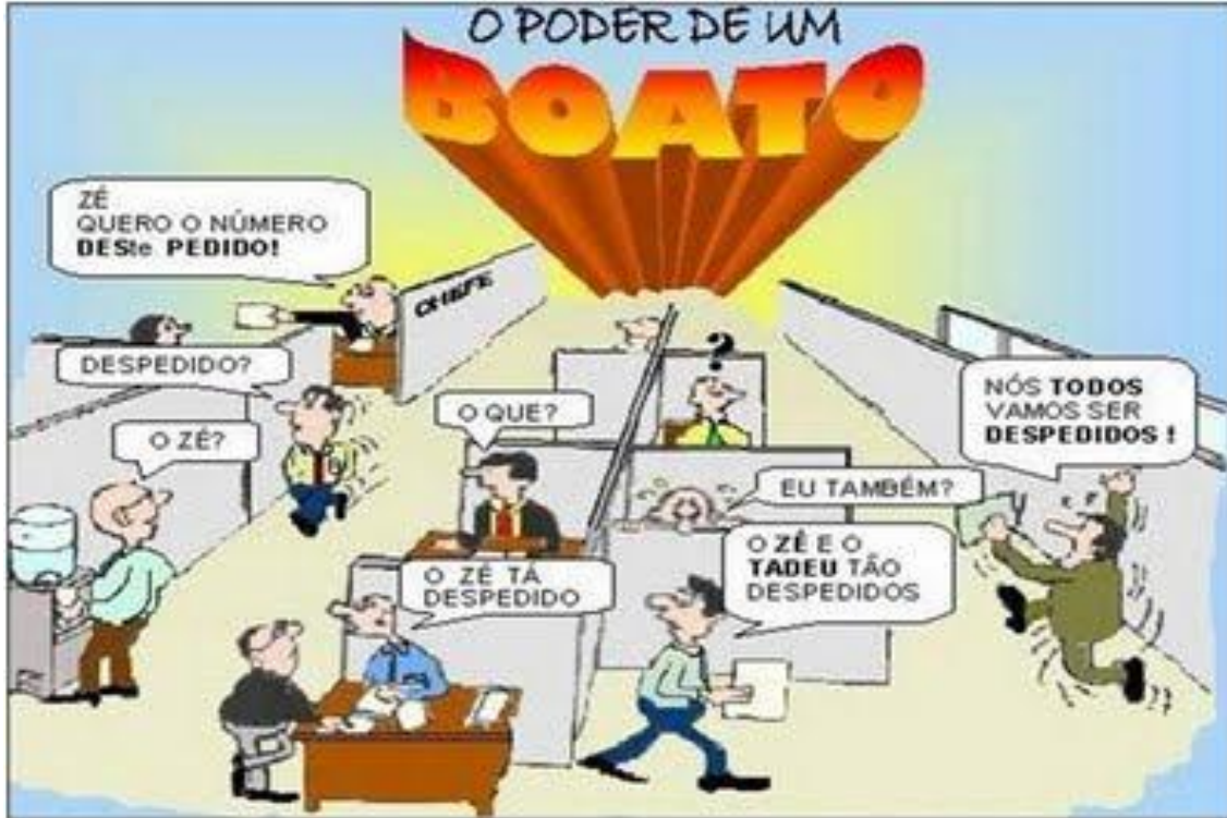
Disponível em: < http://gestaocomunicacaointerna.blogspot.com.br/2012/06/como-perceber-que-comunicacao-interna.html >. Acesso em: 16 out. 2013. 16h44min.

1. Leia a história “O poder de um boato” e veja o que ocorreu após o chefe pedir a um funcionário o número “deste pedido”: